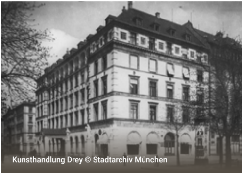
Kunsthandlung Drey

Die Kunsthandlung Drey zählte zu den bedeutendsten Kunsthandelsorten Münchens. 1911 ließ sich die Familie ein Wohn- und Geschäftshaus von Gabriel von Seidl errichten. Doch das nationalsozialistische Regime setzte ihrem Wirken ein Ende: Durch eine Schmähkampagne waren sie gezwungen, das Haus zu verkaufen und den Kunstbesitz zwangszu versteigern. Die Kunsthandlung wurde „arisiert“, die Familie floh.