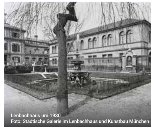
Lenbachhaus um 1930

Welche jüdischen Künstler*innen sind in der Sammlung vertreten und welche ihrer Werke sind heute zu sehen?