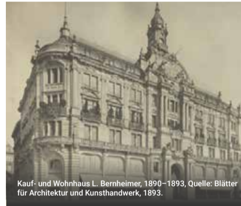
Kauf- und Wohnhaus L. Bernheimer, 1890–1893, Quelle: Blätter für Architektur und Kunsthandwerk, 1893.

Innerhalb weniger Jahrzehnte entwickelte sich das 1864 von Lehmann Bernheimer gegründete Stoffwarengeschäft zu einem der bedeutendsten Kunst- und Ausstattungshäuser Münchens.