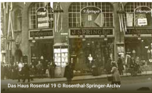
Das Haus Rosenthal 19