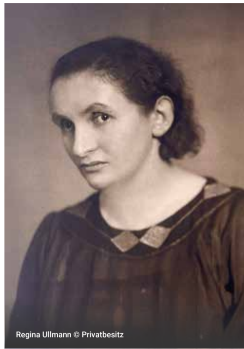
Regina Ullmann

Die in St. Gallen geborene Dichterin Regina Ullmann (1884–1961) zog 1902 nach München.