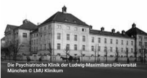
Die Psychiatrische Klinik der Ludwig-Maximilians-Universität München

Seit 1904 werden in der Klinik für Psychiatrie und Psychotherapie in der Nußbaumstraße Menschen mit psychischen Erkrankungen behandelt. Die Patientinnen und Patienten sowie ihre Behandlung wurden in tausenden Akten dokumentiert. Im Rahmen eines Projektkurses werteten Studierende der LMU über 600 Akten von Patientinnen aus den Jahren 1927, 1934 und 1937 aus. Die entstandene Posterpräsentation ist erstmals am historischen Ort zu sehen. Eine Führung durch die Ausstellung legt den Fokus auf ausgewählte Geschichten.