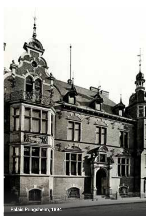
Palais Pringsheim, 1894

Das Palais der Familie Pringsheim war ein Treffpunkt der Münchner Gesellschaft.