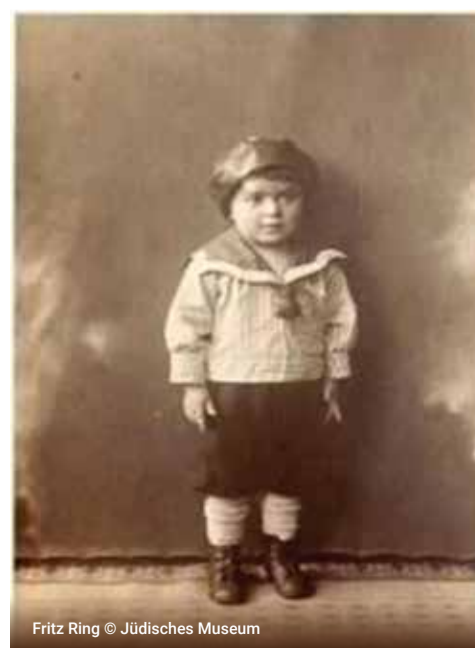
Fritz Ring © Jüdisches Museum