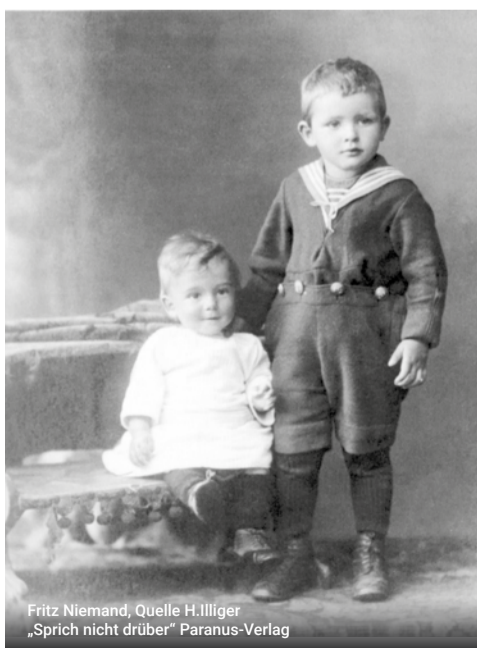
Fritz Niemand, Quelle H. Illiger „Sprich nicht drüber“ Paranus-Verlag